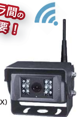
◆WR-C15ML マイクロフォン 赤外線付カメラ(TX)