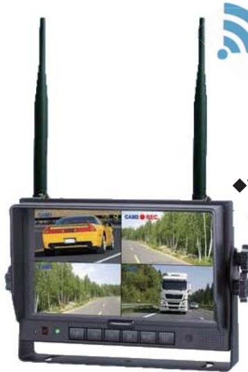
◆WR-D754 4カメラ受信対応 無線モニター(RX)